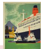
柳原良平作品 リトグラフ 「横浜港」